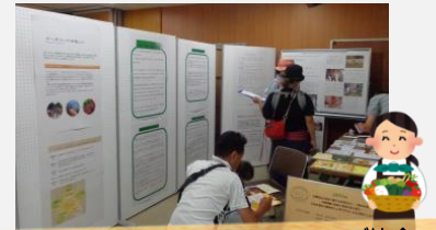
日本オーガニック&ナチュラルフーズ協会 (通称: JONA)

緑のボランティアを育て、その活動を応援する団体です。次世代を担う子どもたちに身近に緑を感じてほしいとの想いを込めた環境教育を行っています。当日は、森をテーマにした紙芝居を「語り部」で上演し、立ち寄ったたくさんのお子どもたちは紙芝居に真剣に耳を傾けてくれました。