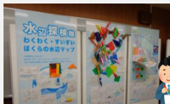
まちふね みらい塾

「地中熱」は日本全国どこでもあなたの足元にある、とても身近なエネルギーです。エコまつりでは、節電・省エネやヒートアイランド現象の緩和にも役立つ地中熱利用の仕組みを、模型とパネルを見ながら紹介しました。