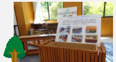
中央区森の応援団

小学生を対象とした、わくわく・すいすい「水辺探検」のワークショップの作品を紹介しました。本年実施分の参加希望は『まちふねみらい塾』(03-6264-8177)までお問い合わせください。