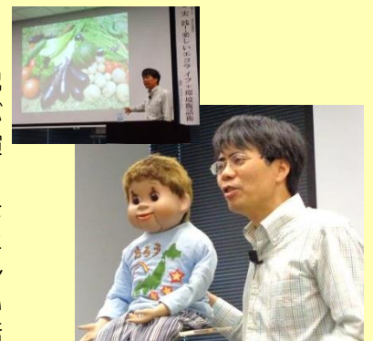
▲エコロジーさんとたろうくん

相棒のたろうくんとの腹話術を交えながら、水道光熱費を抑えたり、ベランダ菜園を作るなど楽しみながらできるエコライフについて、実体験に基づいて楽しくお話し下さいました。