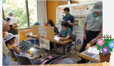
地球緑化センター

中央区開催の第11回『エコまつり』に出展し、5つの環境活動団体と一緒にパネル展示、クイズ、ワークショップ等を行いました。天候にも恵まれたたくさんの方々にご来場いただきました。